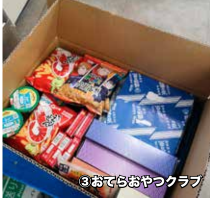
③おてらおやつクラブ