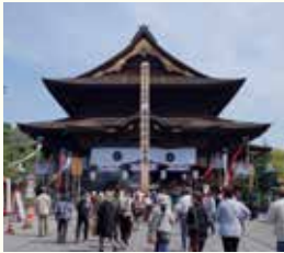
今年の大本山善光寺大本願 の御忌法要は御開帳に合わ せ、5月に行われます。

何よりもご遺族の皆さま まが故人を想い、手を合 わせ、南無阿弥陀仏とお 唱える気持ちになれる 環境が大切です。