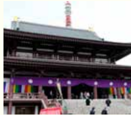
大本山増上寺の御忌法要は 毎年4月に行われます。