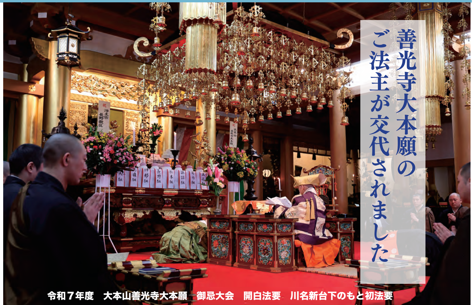
令和7年度 大本山善光寺大本願 御忌大会 開白法要 川名新台下のもと初法要