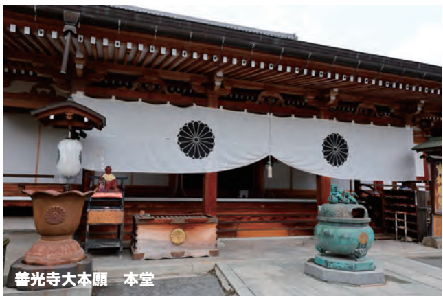
善光寺大本願 本堂