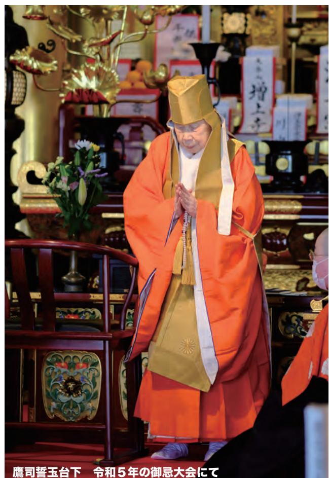
鷹司誓玉台下 令和5年の御忌大会にて