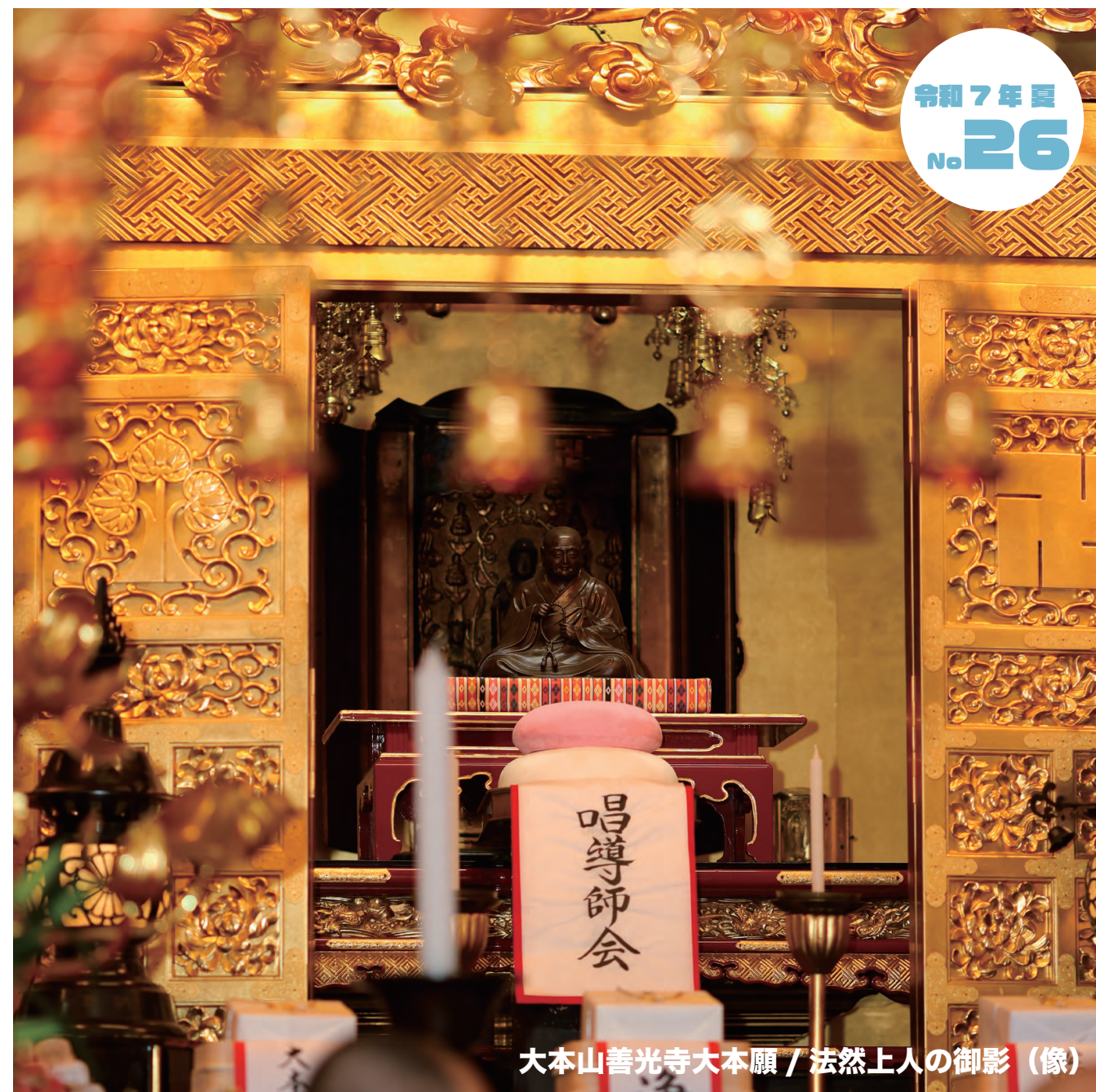
大本山善光寺大本願 / 法然上人の御影 (像)