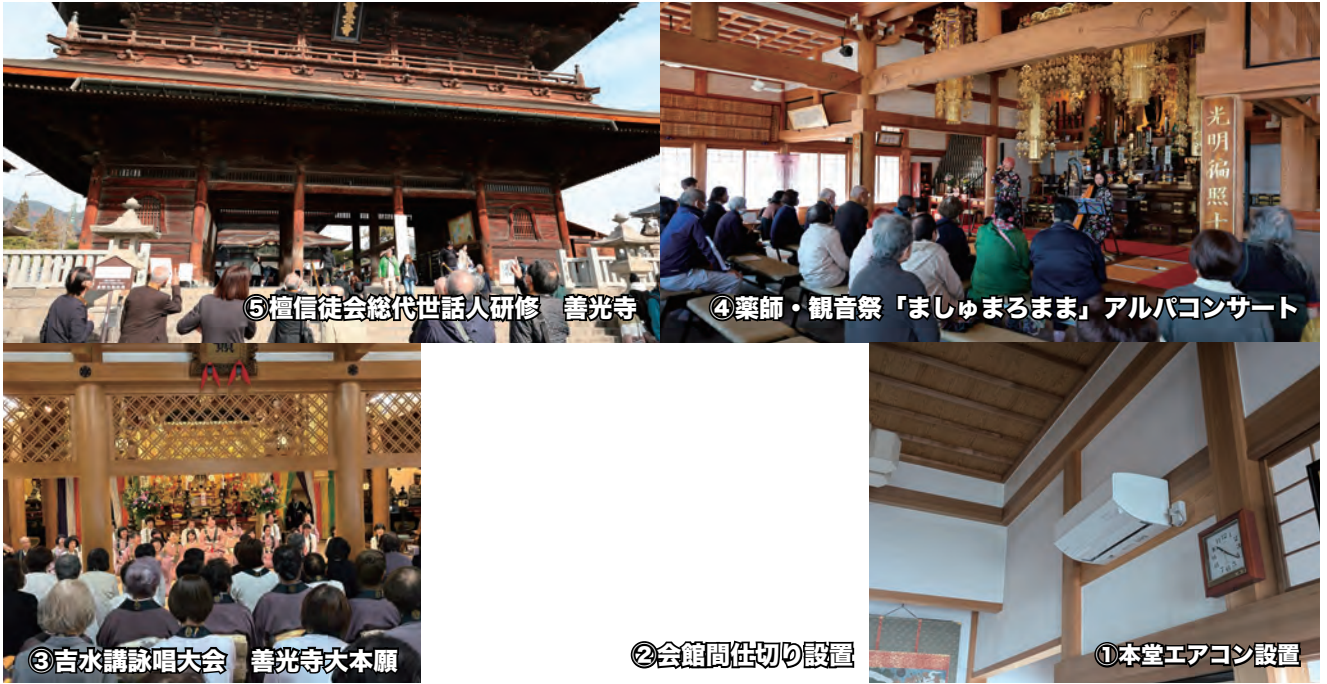
⑤檀信徒会総代世話人研修 善光寺