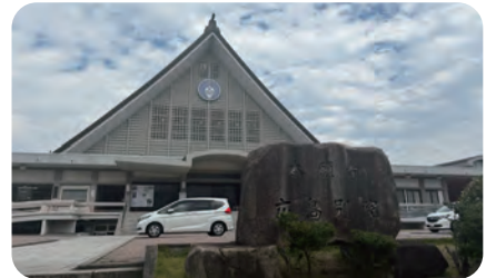
浄土真宗本願寺派 広島別院