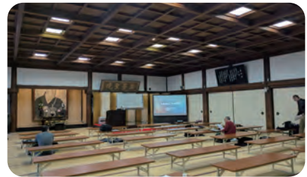
総本山知恩院 教化高等講習会