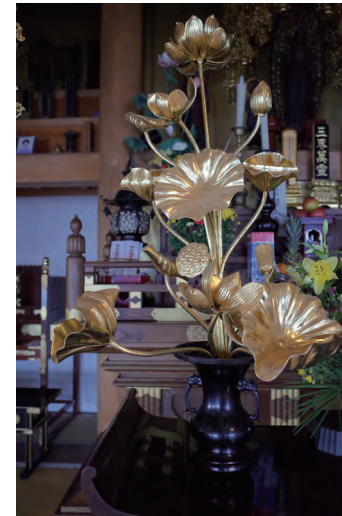
善立寺本尊前の常華 つぼみ・花・実がある