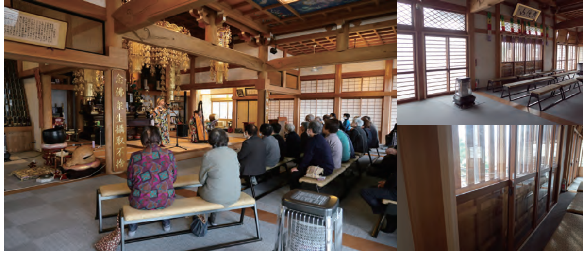
薬師・観音例大祭の様子