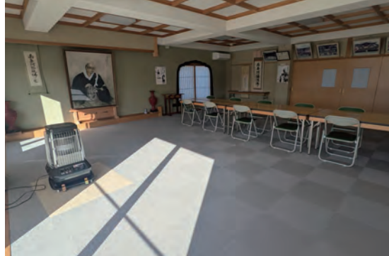
会館のタイルカーペット