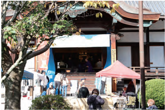
多くの人でにぎわう清浄華院

現在の本堂は1794年、仙洞御所の一部を移築し、御下賜により改装されたものだそうです。 その後、蘆山寺は明治維新まで宮中の仏事を司る4カ寺（蘆山寺、二尊院、般若院、遺迎院）のひとつとして護持されてきました。