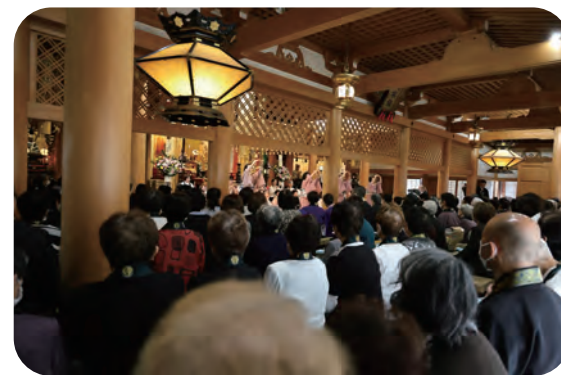
善光寺大本願の内陣での奉納 ドキドキしつつ 楽しんでお唱えします