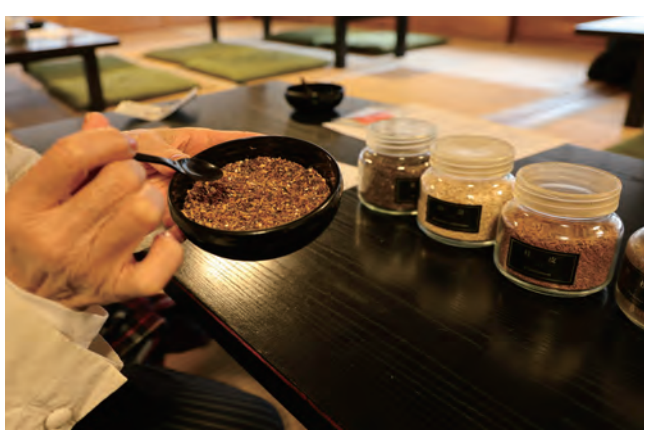
お香専門店による匂い袋制作体験 清浄華院内

さて、蘆山寺の北隣には浄土宗大本山の清浄華院があります。清浄華院の歴史も古く、860年、天台宗のお寺として開かれたのが始まりです。その後、法然上人が後白河天皇、後鳥羽天皇、高倉天皇に戒を授けた功績によりこのお寺を賜り、浄土宗寺院になったと伝わります。今も天台宗との関わりが深く、天台宗の厳しい修行、千日回峰行では行者の宿としてお寺を提供されています。