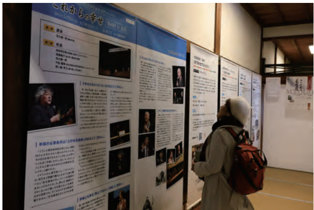
全国の浄土宗寺院の活動紹介も 清浄華院内

そんな中、蘆山寺に伝わる本は各所に推敲の跡や但し書きが記された法然上人直筆で、当時の法然上人の思想、浄土宗を知る大変貴重な書として国指定の重要文化財に登録されています。