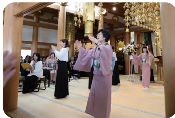
♪みんなで吉水講音頭♪